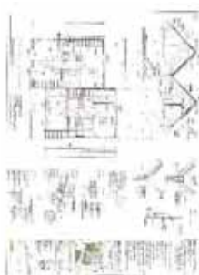
CAD Zeichnung 1